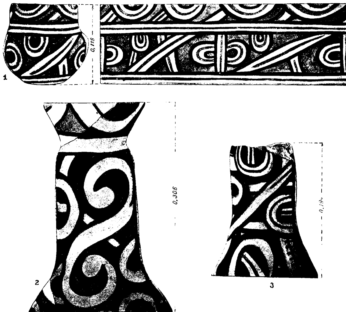
Fig. 3. — 1, vas-pahar din locuința LII; 2, vas suport din locuința LII; 3, vas suport din locuința LV.

unei locuințe mici, de circa 3,5 \text{ m} \times 2 \text{ m} , orientată ENE 1500^\circ/_{00} și VSV 4700^\circ/_{00} . Platforma de lipituri mai bine conservată în jumătatea de est a locuinței, unde majoritatea lipiturilor, provenind de la pereții de pe laturile lungi ale locuinței și mai puțin de pe cele înguste, prezentau pe fața lor inferioară urme de bețe și de nuiele. În restul locuinței erau urme mai sporadice de lipituri, exceptînd colțul de SV, unde s-a păstrat o porțiune mai bine conservată de lipituri, groase de 3—4 cm și cu urme de scînduri și nu de nuiele pe fața lor inferioară. La fel și