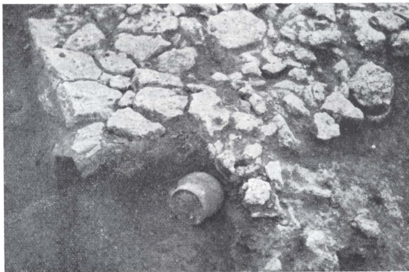
Fig. 2. — Detaliu din colțul de SV al locuinței LII.

cea mai mare parte în colțul de SV al locuinței, printre bucățile de lipituri de podea sau de pereți. Alte fragmente ceramice din vase pictate sau cu decor incizat, precum